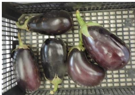
SAMBA (DIAMOND SEEDS)