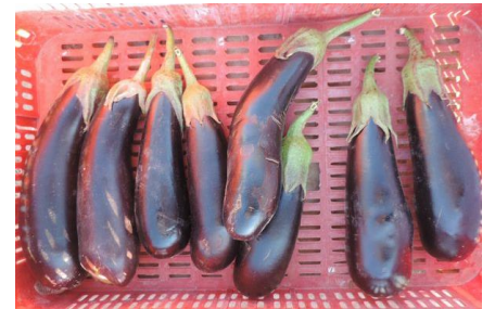
GRETA (RIJK ZWAAN)