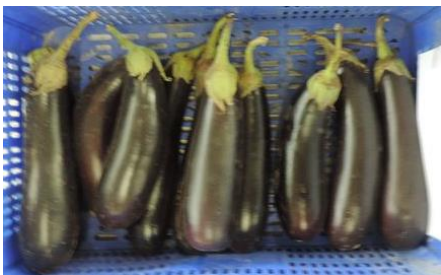
NILO (RIJK ZWAAN)