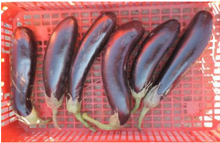
SONORA (AR-04082) (R. ARNEDO)