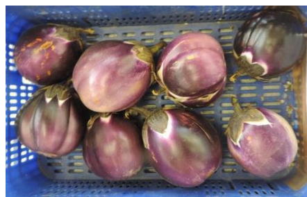
BRISKA (JAD IBÉRICA)