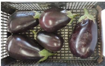
BLACK BELL (SEMINIS)