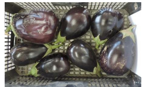
PARIS (R. ARNEDO)