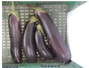
TERESA (DIAMOND SEEDS)